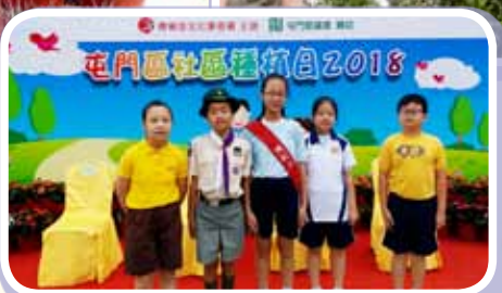
本校服務團體參與康文署種植日活動，並與嘉賓合照