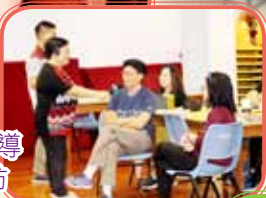
「溝通與輔導 技巧」工作坊