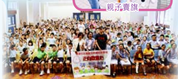
正向啟童心啟動禮