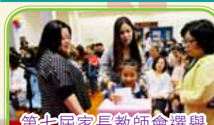
第七屆家長教師會選舉