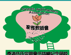
僑港伍氏宗親會伍時暢紀念學校