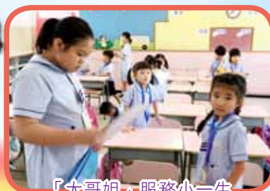
「大哥姐」服務小一學生