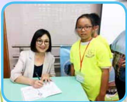
成長的天空啟動禮