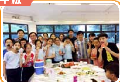
畢業班宿營用餐情況