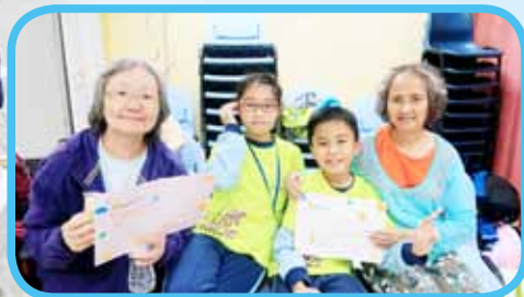
愛心之旅，探訪老人院