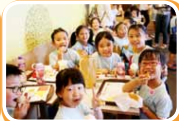
屯門黃金海岸商場 購買食物享用