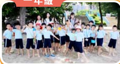
屯門黃金海岸堆沙活動