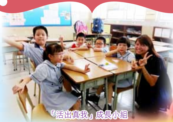
「活出真我」成長小組