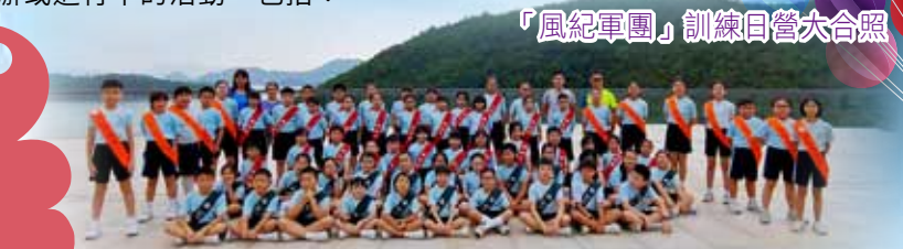
「風紀軍團」訓練日營大合照