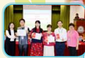
積極推薦校友 教師獎