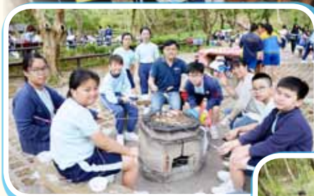
同學們在馬鞍山郊野公園進行不同的活動