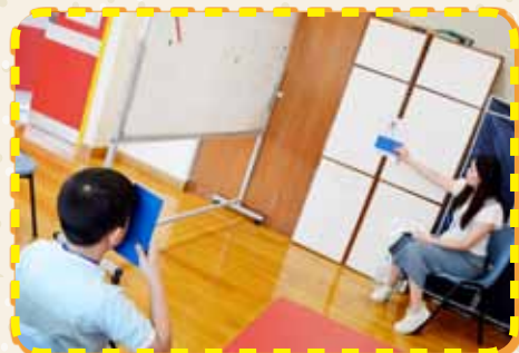
中大醫護悉心為同學檢測眼睛的屈光、色盲及視力情況。