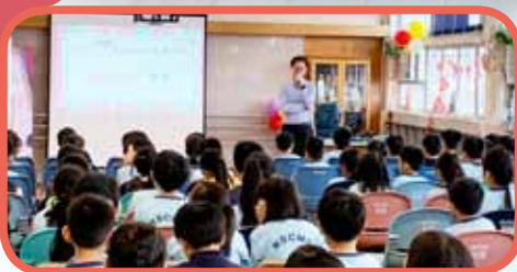
「誠實豆沙包」學生講座