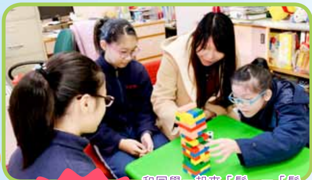
和同學一起來「鬆」一「鬆」