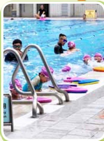
本校為推廣游泳，特別津貼小一同學參加游泳班