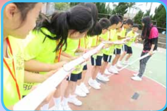
挑戰自我，突破障礙

本計劃由教育局撥款，學校與基督教香港信義會屯門青少年綜合服務中心合作，在小四至小六年級推行「成長的天空」計劃，為學生、家長及老師進行各類有關抗逆力的活動及課程。