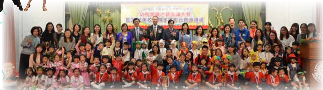
嘉賓評判和各參賽者合照