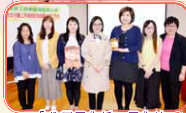
「分層工作紙」工作坊