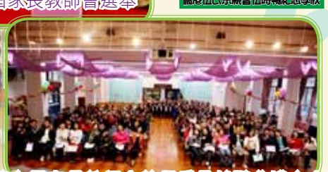
第七屆家長教師會執行委員就職典禮大合照