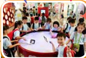
九龍公園 食衛中心參觀