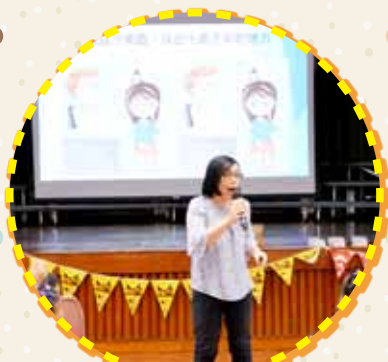
中大醫護透過問答遊戲加深同學護眼的常識。