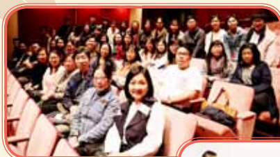
屯門聯校教師發展日 主題講座