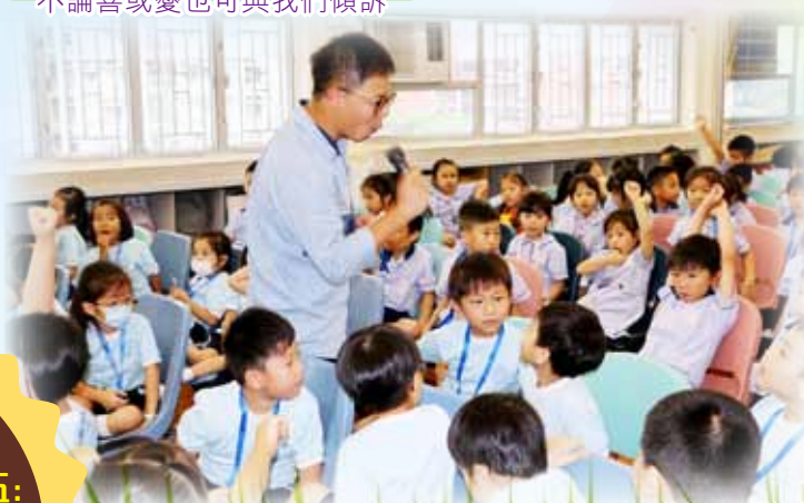
黃Sir主講生活課講座