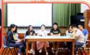
「正向教育齊起動」分享