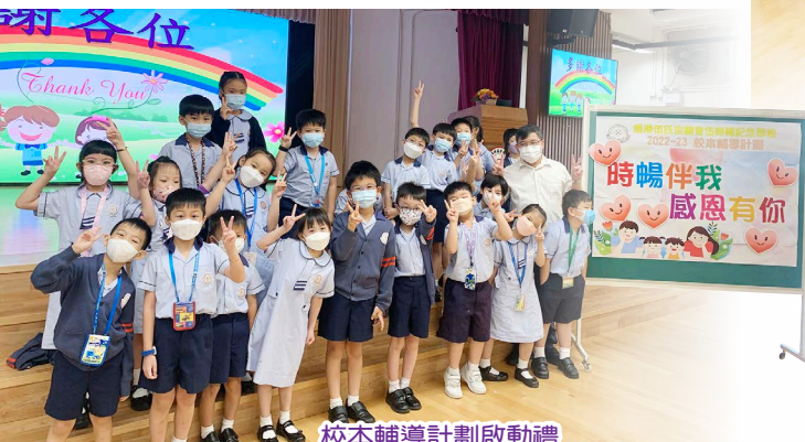
校本輔導計劃啟動禮