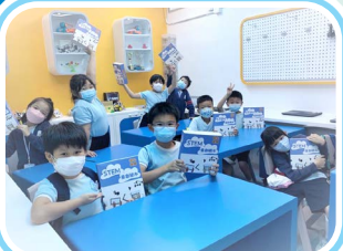
「童創機械積木」課程