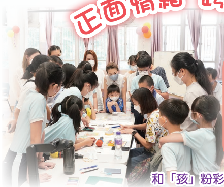
和「孩」粉彩親子活動