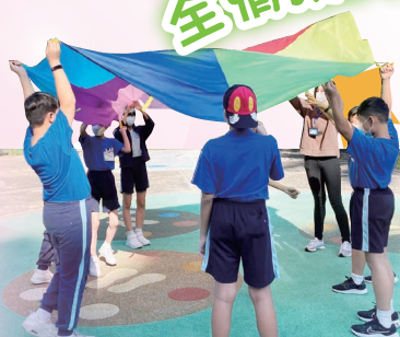
小六成長的天空日營