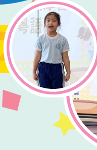
朗誦觀摩會 英語組