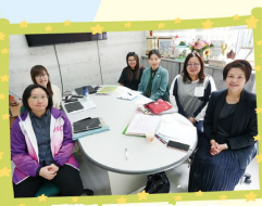
香港中文大學 英文科 QSP 優質學校改進計劃