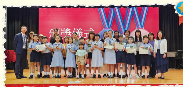
聯校國慶日問答比賽

本校積極推行國民教育，以培養學生的國家身份認同。通過每週舉行升旗禮及國旗下講話，並透過多元學習活動，加強同學認識中國歷史文化與國家發展成就，有助學生建立對中華民族的歸屬感。培養學生成為有擔當、愛國愛港的社會棟樑，為國家與香港的繁榮穩定作出貢獻。