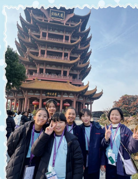
五年級 武漢姊妹學校交流團