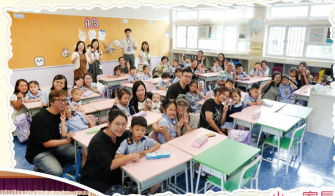
小一家長學生也開學