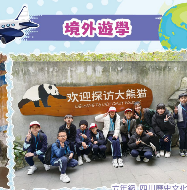
六年級 四川歷史文化及生態探索之旅