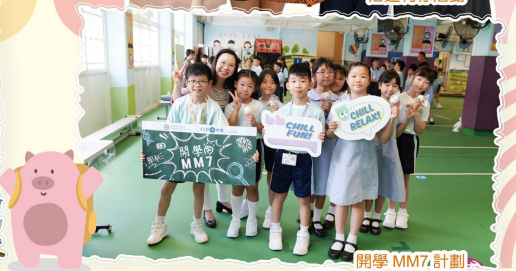
開學 MM7 計劃