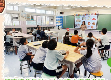
健康飲食活動：「少鹽少糖煮食班」