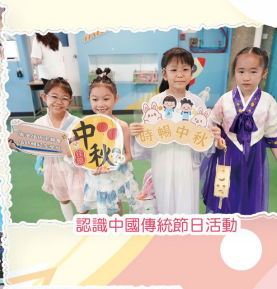
認識中國傳統節日活動