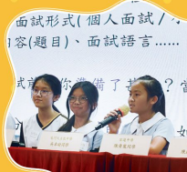
面試形式(個人面試/小組面試) 內容(題目)、面試語言.....

本校特意舉辦小六升中資訊日，除了安排學生及家長到訪中學參觀外，還誠邀區內多間受歡迎學校校長以及校友到校進行講座，讓學生及家長及早掌握升中資訊，做好升中準備。