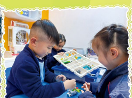
LEGO WeDo 2.0 創意課程