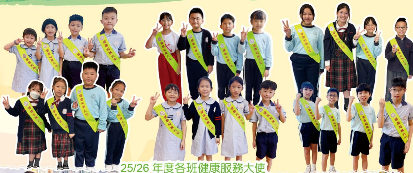
25/26 年度各班健康服務大使

學校定期舉辦培養學生建立良好生活習慣的活動，例如午間護脊操、健康講座、聖誕健營小食聯歡會等，並且在各班設健康服務大使協助推展活動，鼓勵同學積極實踐健康生活好習慣。