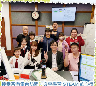
接受香港電台訪問，分享學習 STEAM 的心得