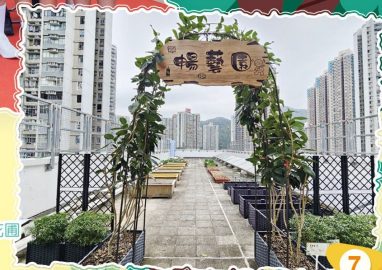
園藝組綠化天台花園