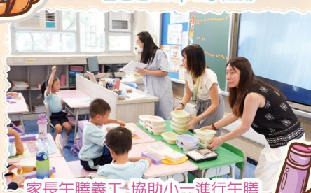
家長午膳義工協助小一進行午膳