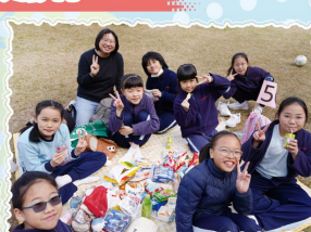
四至六年級 烏溪沙青年新村