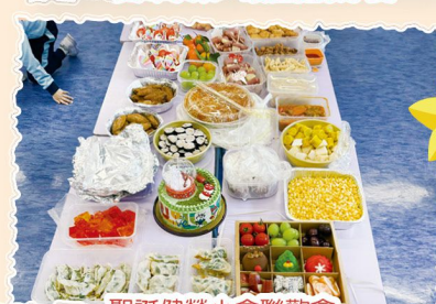
聖誕健營小食聯歡會