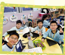
香港中文大學 英語聯盟全港英語計劃