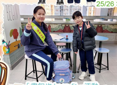
「書包也 keep fit」活動