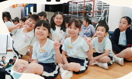
班長及服務生訓練