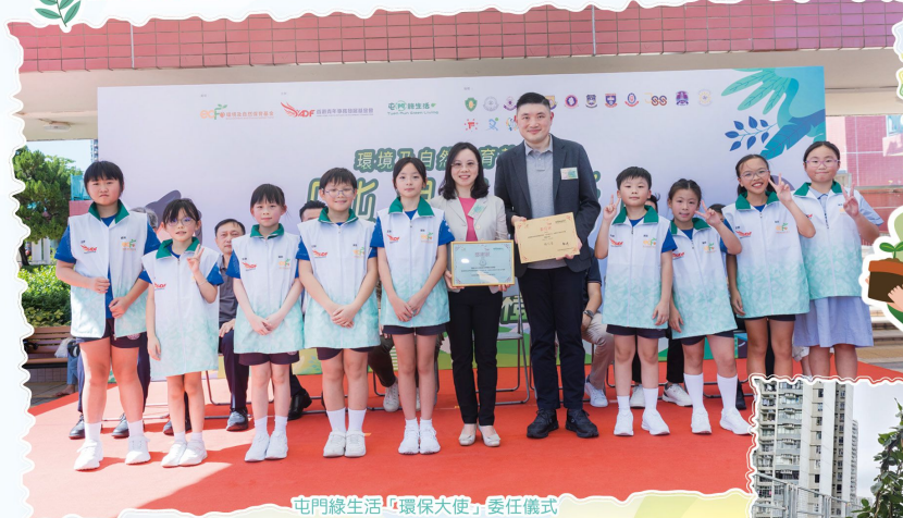
屯門綠生活「環保大使」委任儀式