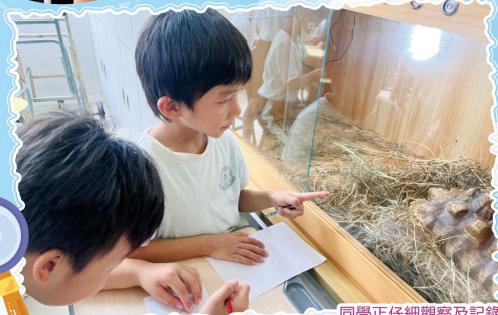
同學正仔細觀察及記錄「伍千歲」的特徵