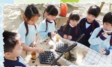
一年級 森林小老闆