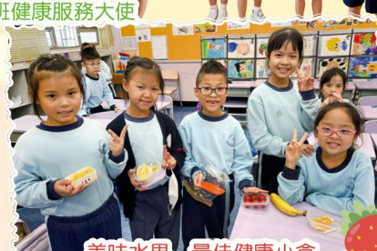
美味水果 最佳健康小食