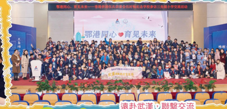
遠赴武漢，聯繫交流