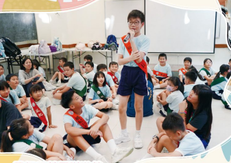
風紀日營團隊遊戲