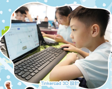
Tinkercad 3D 設計

同學全年可參加一項核心活動及三項自選活動，激發同學對不同領域的興趣，實現全人發展。