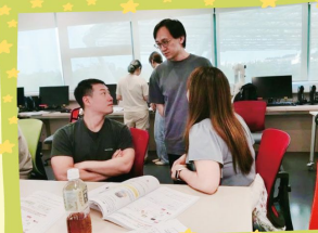
香港教育大學 電腦科 AlphaAI 機器學習 課程研究項目