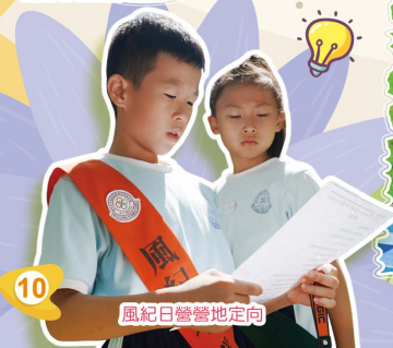
風紀日營營地定向