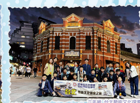
六年級 台北藝術文化探索之旅