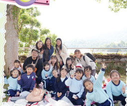
一至三年級 大埔海濱公園