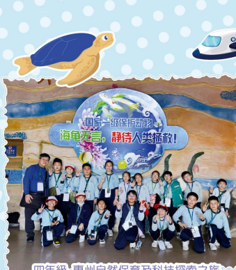
四年級 惠州自然保育及科技探索之旅