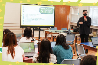
數學科 跨校遊戲學習計劃