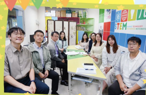
小學課程主任學習社群 STEAM 教育支援計劃

本年度，中文科、英文科、數學科、人文科、科學科、電腦科和體育科分別參加了不同的協作計劃，透過外界資源提升教學效能，促進學生的學習。