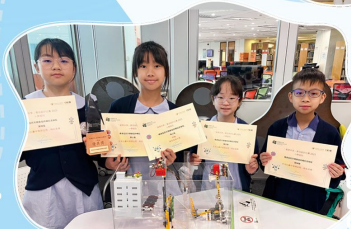
獲得「Make an Impact」 Product Design Competition 2025 優異獎