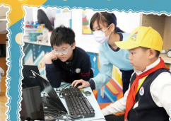
武漢三角湖小學師生訪校參觀