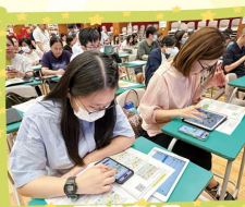
香港教育大學 運用人工智能 (AI) 於中國語文、 英國語文、數學、小學科學及小學 人文教學釋放小學生的潛能