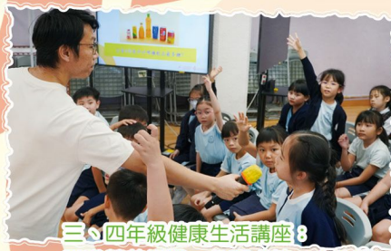
三、四年級健康生活講座8 認識營養標識—免墮「糖」衣陷阱