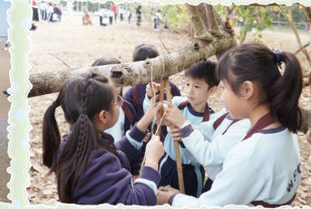
三年級 小小建築師