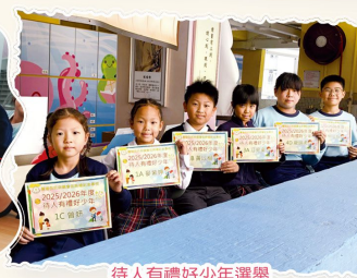
待人有禮好少年選舉