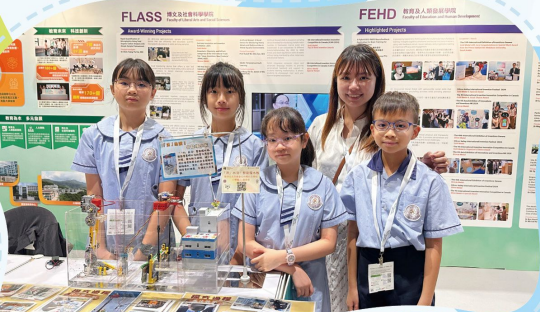
於「學與教博覽2025」向公眾展示得獎發明「 洪，出沒！智能擋水板 」