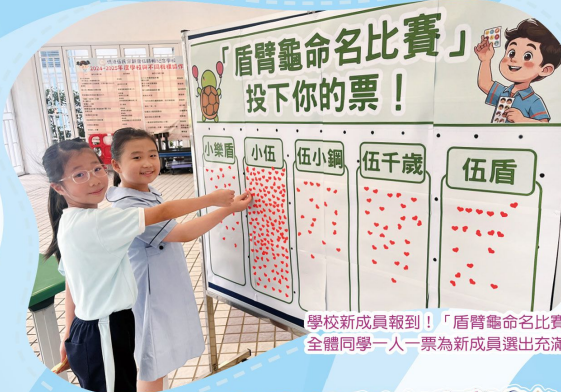
學校新成員報到！「盾臂龜命名比賽」結果揭曉。全體同學一人一票為新成員選出充滿福氣和紀念意義的名字—— 伍千歲