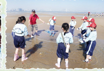
二年級 學做小漁夫