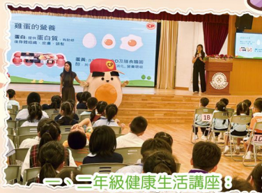
二、三年級健康生活講座8 健康早餐知多少